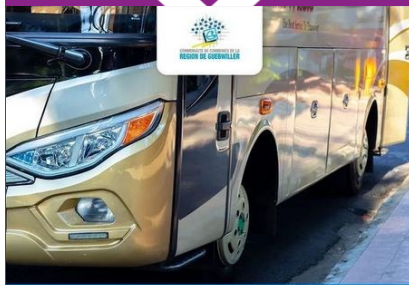
Navette partant de Guebwiller en direction des gares de Bollwiller et de Rouffach

Attention des ajustements sont encore en cours.