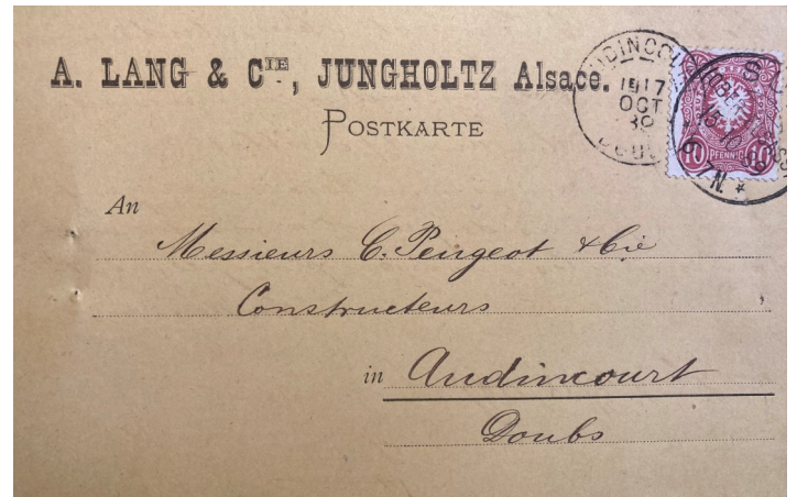
Fig. Carte postale avec en-tête adressée en octobre 1889 à Constant Peugeot & Cie, usine de petite métallurgie basée à Audincourt

La société A. Lang & Cie entendait profiter de l'épanouissement que connaissait la filature de schappe dans les années 1850-1860, mais également de la proximité de Soultz et Guebwiller, véritable pays de la soie enclavé dans un pays de coton, qui offrait à leur usine des débouchés intéressants (en 1858, cette enclave comptait quatre rubaneries à Soultz (Edouard Hoffmann-Eglin & Cie, Jean Caspar Kunkler & Cie, Daniel Meyer-Merian & Cie et Stocker & Hildenbrand) et une à Guebwiller (de Bary-Merian & Fils).. Parallèlement, l'ouverture de l'exploitation coïncidait avec une époque où leurs produits étaient très demandés pour la fabrication de franges, gants et résilles.