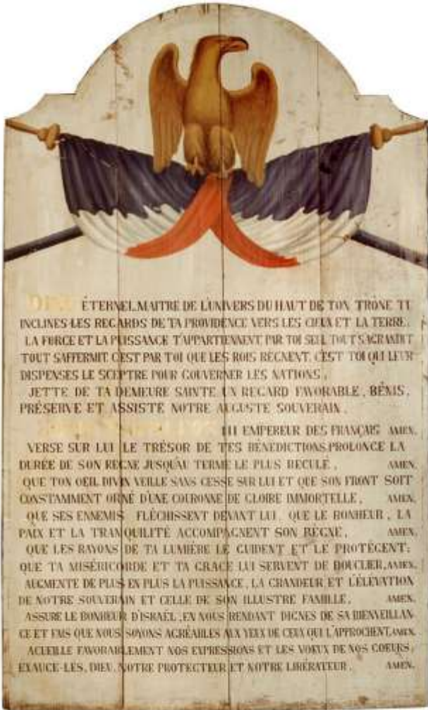
Fig. 2. Tableau de prière pour Napoléon III, 1860. Collection Société d'Histoire des Israélites d'Alsace et de Lorraine (SHIAL). Musée Alsacien de Strasbourg

Dès l'origine le bâtiment servait également d'école talmudique. Le bâtiment comprenait, en effet, deux niveaux : un rez-de chaussée en maçonnerie et un étage en bois. Au rez-de-chaussée était aménagé un logement pour le maître d'école comprenant une cuisine, un poêle (Stuben), deux chambres, une cave et une écurie. La synagogue était établie à l'étage. En 1863, la salle de la synagogue menaçait ruine et dut être restaurée. Dans les années 1880, la synagogue servit de réfectoire aux ouvriers de la filature de shappe Lang & Cie. En 1896, la synagogue désaffectée fut transformée en maison de rapport. Le Musée Alsacien de Strasbourg expose une Maguen David en bois sculpté de 1770 et deux panneaux de prière pour Napoléon III, datant de 1860, l'un en français, l'autre en hébreu, provenant de la synagogue désaffectée de Jungholtz.