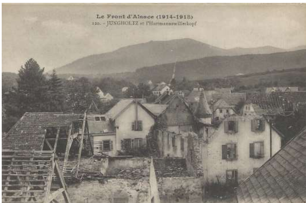
Fig. 5. Le « vordere Schloss » en ruine au lendemain de la Première Guerre mondiale.

La demeure a été fortement endommagée lors des bombardements de décembre 1915 puis rasée.]