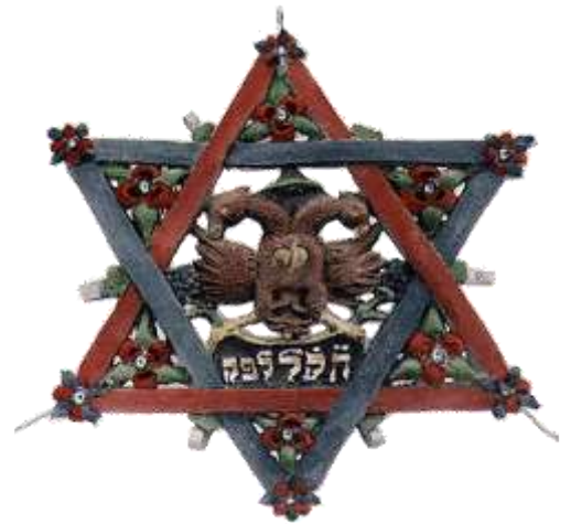
Fig. 3. Maguen David : objet liturgique se trouvant dans la synagogue, 1770. Collection SHIAL. Musée Alsacien de Strasbourg.

Le bâtiment de l'ancienne synagogue connue sous le nom de « Judasschüal » correspond au n°2 de la rue de l'Usine.