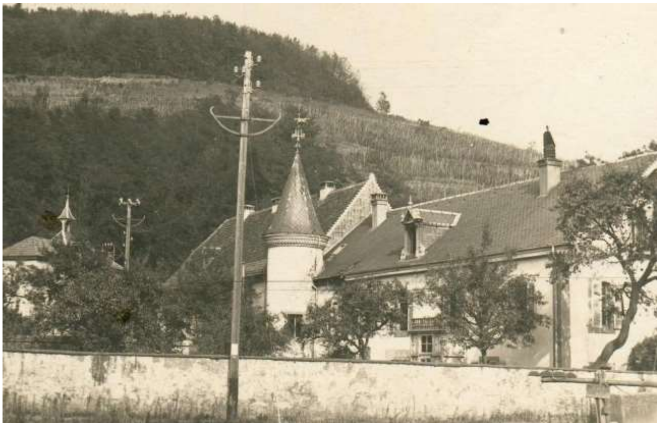
Fig. 4. Le « vordere Schloss » vers 1908.

Une maison de maître était située dans le parc actuel.