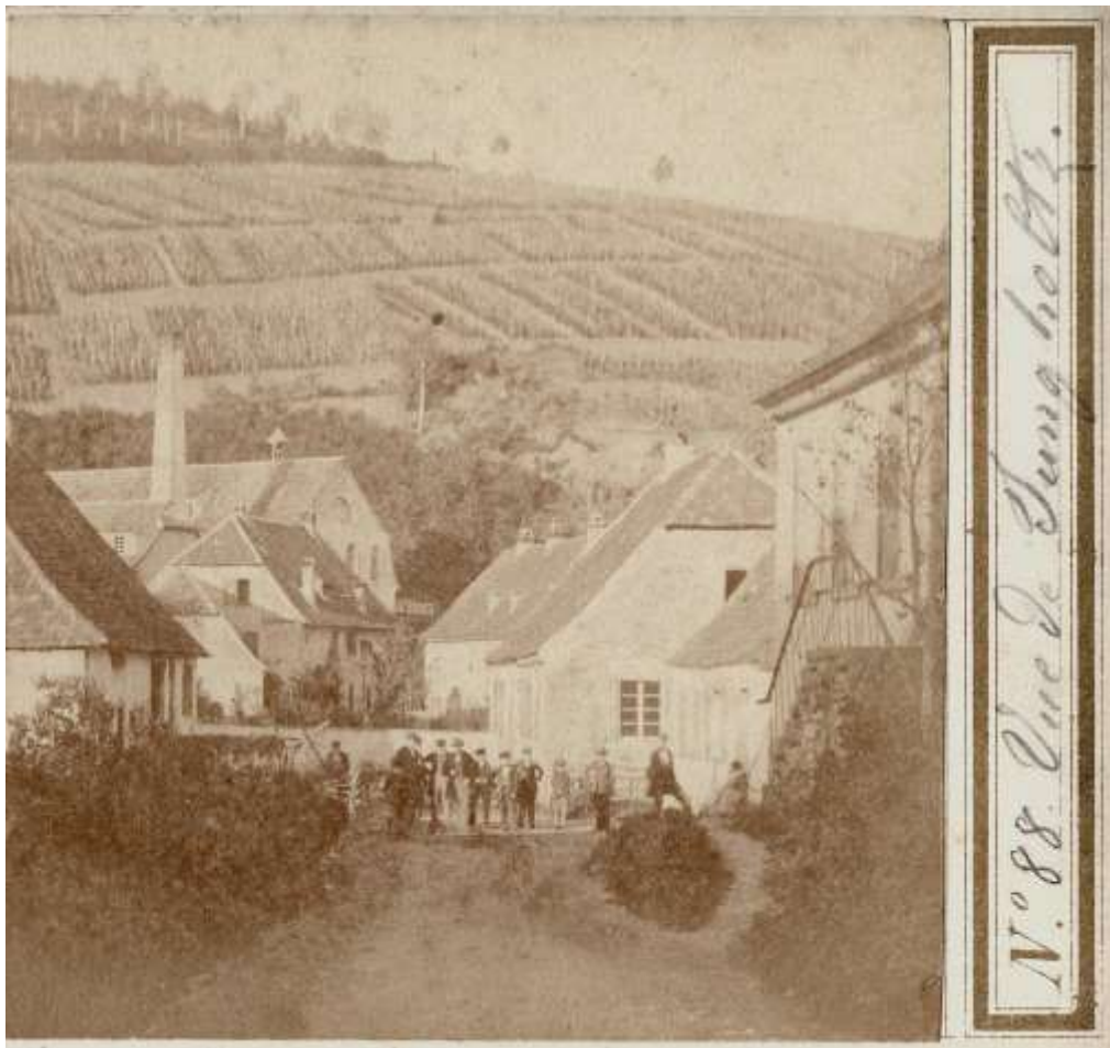
Fig. 1. Vue du début de la rue de Thierenbach et de la rue de l'Usine entre 1857 et 1865. Adolphe Braun édite les premières séries de vues stéréoscopiques à partir de 1857. On observe à l'arrière de l'usine le vignoble du Bintzbourg.

[Le terme de « Judengasse » est attesté dès 1731. La majorité des Juifs de Jungholtz habitait alors dans ce quartier situé dans la partie du village dépendante du ban de Rimbach. Le Rimbach était alors la limite entre les bans de Sultz et Rimbach. Un embryon de communauté juive apparut à Jungholtz dès la première moitié du XVII e siècle. En 1655, les Juifs obtinrent des seigneurs de Schauenbourg une parcelle de terrain dans les fossés du château, afin d'y ensevelir leurs morts (cependant, la plus vieille dalle funéraire, actuellement lisible, date de 1624). Les concessions successives finissent par occuper l'ensemble du fossé du château.]