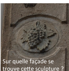
Sur quelle façade se trouve cette sculpture ?

Pour préparer au mieux cette animation, la "commission patrimoine" fait appel à vous pour la réalisation d'un livret qui permettra de guider petits et grands à travers les rues du village pour découvrir notre patrimoine.