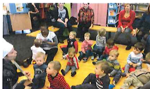
Le moment des histoires !