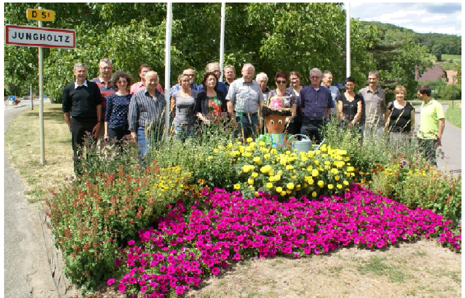
Le jury régional lors de son passage le 30 juillet.

villages fleuris). Le jury, issu du monde horticoles, de responsables communaux et d'espaces verts ou de représentants du tourisme, a posé des questions pertinentes, en particulier sur l'emploi des produits phytosanitaires, les actions en faveur de la biodiversité et de l'espace naturel ou sur la politique budgétaire consacrée au fleurissement. Ainsi, après délibération du jury, la commune de Jungholtz a eu