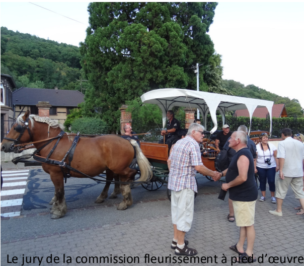
Le jury de la commission fleurissement à pied d'œuvre.

La reconnaissance de ce savoir-faire et la remise des prix aura lieu comme à l'accoutumée à l'issue de la cérémonie des vœux du Maire dans la salle polyvalente.